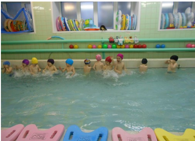
Дети «заводят моторчики»

Чтобы дети не боялись воды, особенно, если она попадает в лицо, инструктор использует разнообразные игровые упражнения: «Дети, дети, вырастайте!», «Моторчик» и др. Затем,