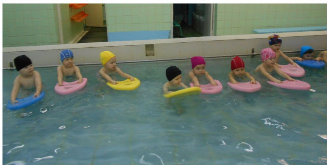
Дети выполняют упражнения с лодочками.