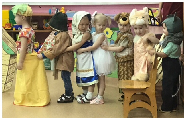
Дебют юных артистов. Сказа «Колобок».

В нашей группе праздник начался ещё в начале ноября, когда открылась выставка «А у мамы руки золотые!». Мама оказались настоящими волшебницами и раздевалка превратилась в галерею!. Помимо этого раздевалку украсила поздравительная газета с фотографиями и гороскопом. Кульминацией празднования Дня матери стало шуточно-музыкальное развлечение «Вместе с мамой!». Дети выучили стихи и песни, показали сказку «Репка», приготовили подарки, а мамы состязались в шуточных и творческих конкурсах. В финале – флэш-моб и чаепитие.